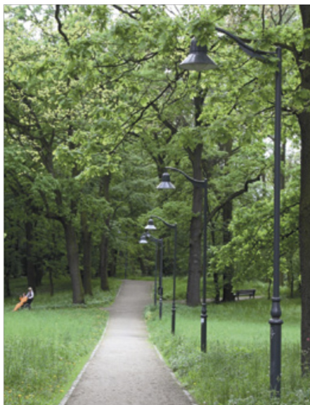
Stylizowany parkowy słup dekoracyjny